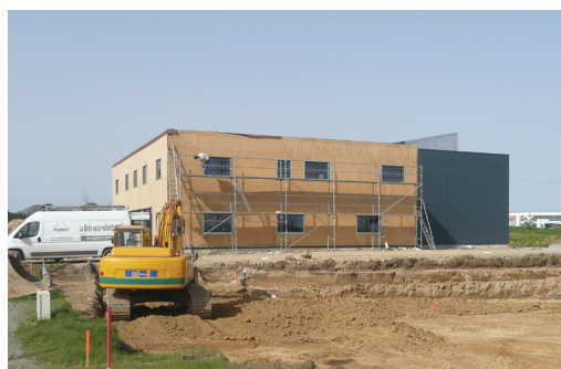
Locaux d'activité à Guipavas (zone de Prat Pip)

Sur un plan spatial, l'offre se localise au Nord-est de l'agglomération brestoise et dans une moindre mesure sur le port de commerce. Ces deux espaces sont les plus actifs en investissement de bureaux : ils représentent 60 % de l'ensemble de l'offre totale disponible et les 2/3 de l'offre de moins d'un an, signe de leur dynamisme.