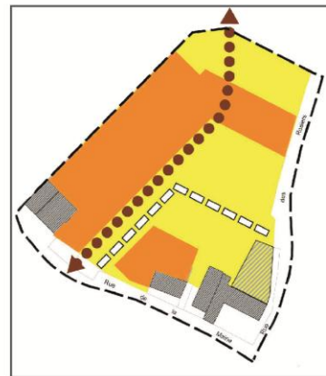
Schéma indicatif non prescriptif et images de référence