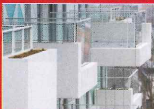
Bandeaux de façade en béton lisse blanc (Boulogne-Billancourt - 92) BATEG - Beckmann - N'Thépé