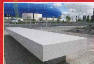
Mobilier urbain Stade Océane (Le Havre - 76) EUROVIA - Richez et Associés