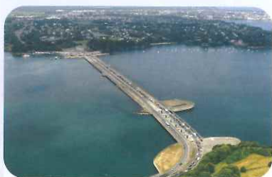
Marées : une exploitation historique en Bretagne