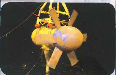
L'hydrolienne retrouvera bientôt son courant

Chimie Ils améliorent les cellules photovoltaïques